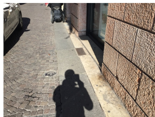
Foto del rilievo

Pavimentazione con sconnessioni dovute alle fugature